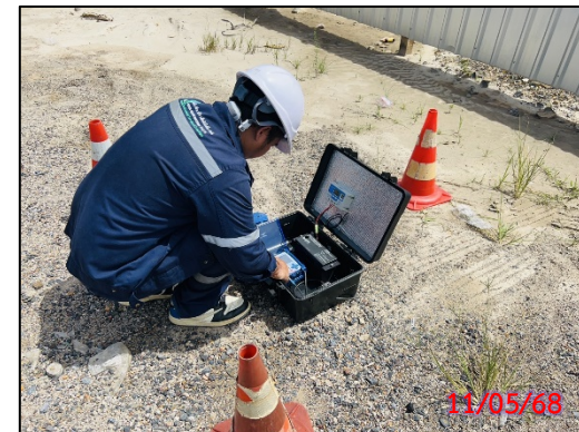
รูปที่ 3.7-5 จุดตรวจวัดระดับความสั่นสะเทือน ประจำเดือนพฤษภาคม 2568 (ระหว่างวันที่ 11-14 พฤษภาคม 2568)