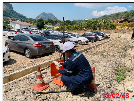
รูปที่ 3.6-2 จุดตรวจวัดระดับเสียงทั่วไป ประจำเดือนกุมภาพันธ์ 2568 (ระหว่างวันที่ 13-16 กุมภาพันธ์ 2568)