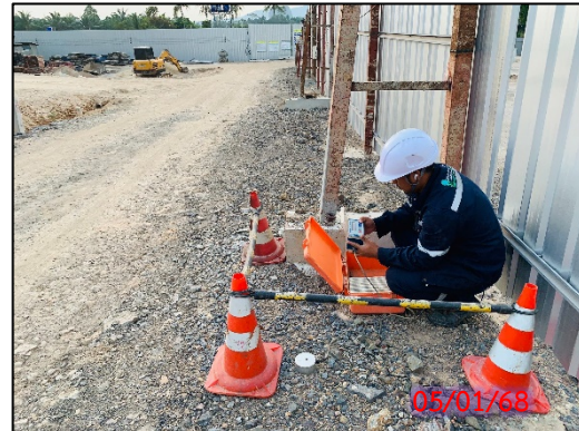
รูปที่ 3.7-1 จุดตรวจวัดระดับความสั่นสะเทือน ประจำเดือนมกราคม 2568 (ระหว่างวันที่ 05-08 มกราคม 2568)