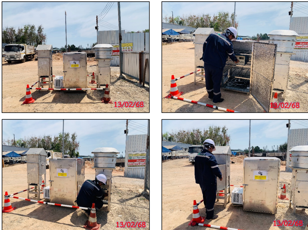
รูปที่ 3.5-2 จุดตรวจวัดคุณภาพอากาศในบรรยากาศโดยทั่วไป ประจำเดือนกุมภาพันธ์ 2568 (ระหว่างวันที่ 13 - 16 กุมภาพันธ์ 2568)