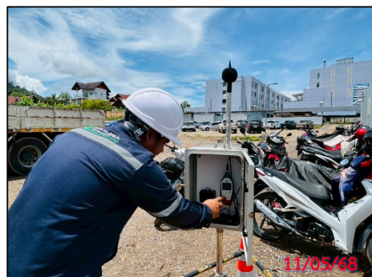
รูปที่ 3.6-5 จุดตรวจวัดระดับเสียงทั่วไป ประจำเดือนพฤษภาคม 2568 (ระหว่างวันที่ 11-14 พฤษภาคม 2568)