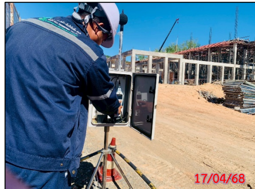
รูปที่ 3.6-4 จุดตรวจวัดระดับเสียงทั่วไป ประจำเดือนเมษายน 2568 (ระหว่างวันที่ 17-20 เมษายน 2568)