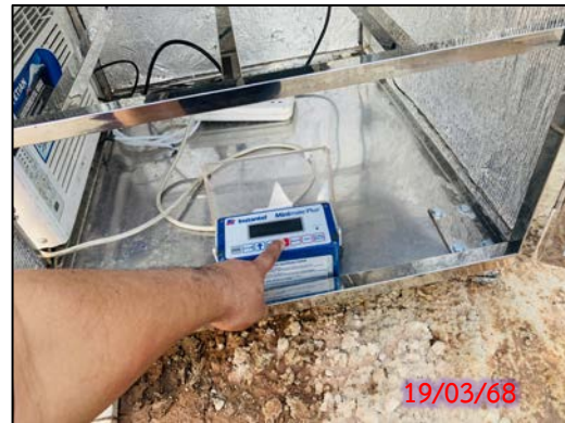
รูปที่ 3.7-3 จุดตรวจวัดระดับความสั่นสะเทือน ประจำเดือนมีนาคม 2568 (ระหว่างวันที่ 19-22 มีนาคม 2568)