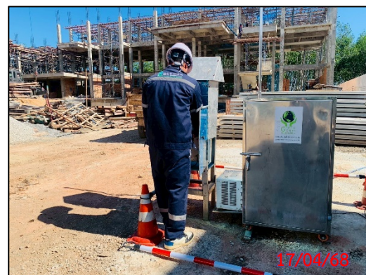
รูปที่ 3.5-4 จุดตรวจวัดคุณภาพอากาศในบรรยากาศโดยทั่วไป ประจำเดือนเมษายน 2568 (ระหว่างวันที่ 17-20 เมษายน 2568)