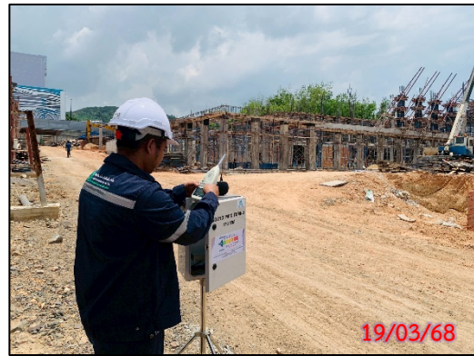
รูปที่ 3.6-3 จุดตรวจวัดระดับเสียงทั่วไป ประจำเดือนมีนาคม 2568 (ระหว่างวันที่ 19-22 มีนาคม 2568)