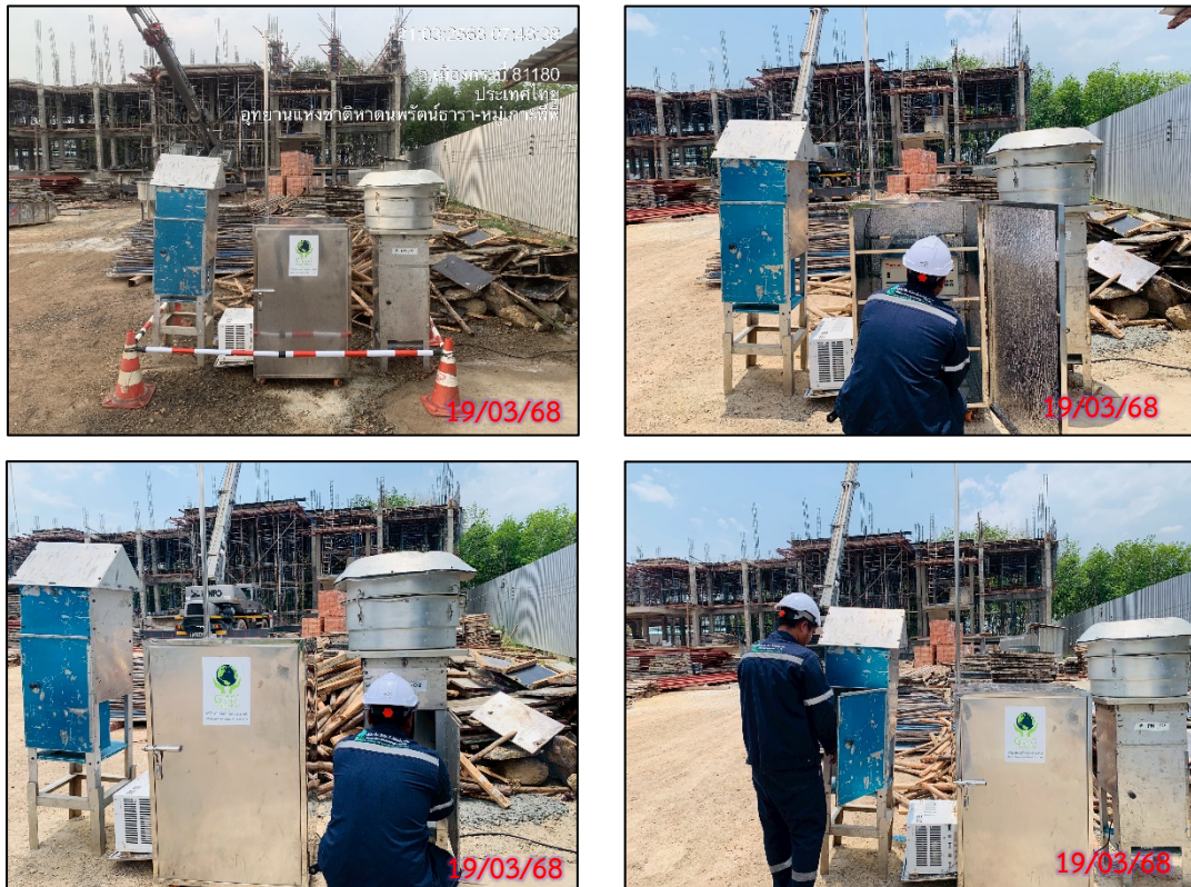
รูปที่ 3.5-3 จุดตรวจวัดคุณภาพอากาศในบรรยากาศโดยทั่วไป ประจำเดือนมีนาคม 2568 (ระหว่างวันที่ 19-22 มีนาคม 2568)

ที่มา : บริษัท กรีน เอ็นไว เอ็นจิเนียริง จำกัด, 2568