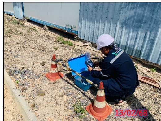
รูปที่ 3.7-2 จุดตรวจวัดระดับความสั่นสะเทือน ประจำเดือนกุมภาพันธ์ 2568 (ระหว่างวันที่ 13-16 กุมภาพันธ์ 2568)