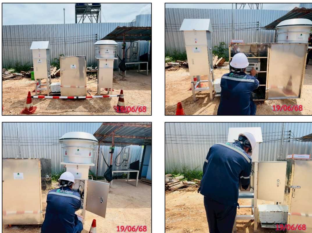
รูปที่ 3.5-6 จุดตรวจวัดคุณภาพอากาศในบรรยากาศโดยทั่วไป ประจำเดือนมิถุนายน 2568 (ระหว่างวันที่ 19-22 มิถุนายน 2568)