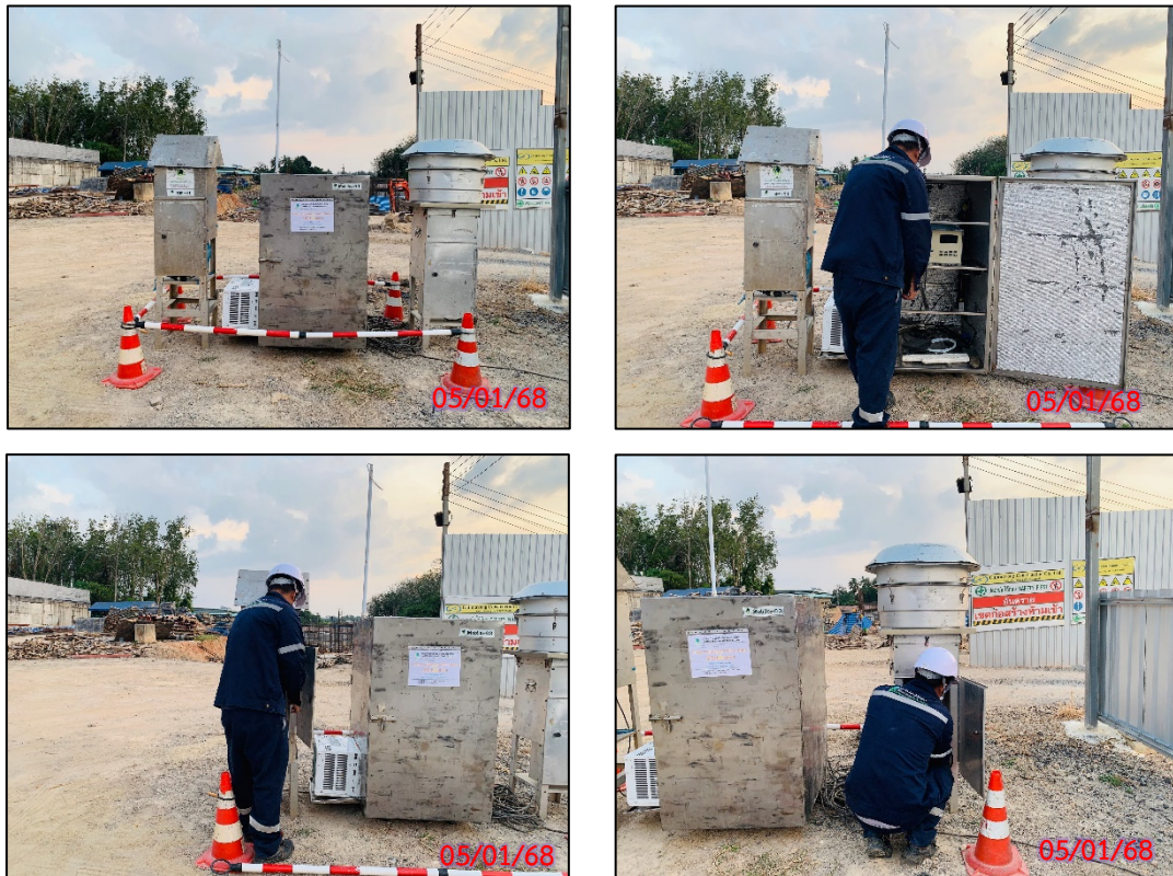
รูปที่ 3.5-1 จุดตรวจวัดคุณภาพอากาศในบรรยากาศโดยทั่วไป ประจำเดือนมกราคม 2568 (ระหว่างวันที่ 05-08 มกราคม 2568)