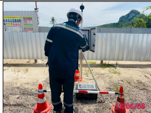
รูปที่ 3.6-6 จุดตรวจวัดระดับเสียงทั่วไป ประจำเดือนมิถุนายน 2568 (ระหว่างวันที่ 19-22 มิถุนายน 2568)