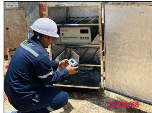
รูปที่ 3.7-4 จุดตรวจวัดระดับความสั่นสะเทือน ประจำเดือนเมษายน 2568 (ระหว่างวันที่ 17-20 เมษายน 2568)

ที่มา : บริษัท กรีน เอ็นไว เอ็นจิเนียริง จำกัด, 2568