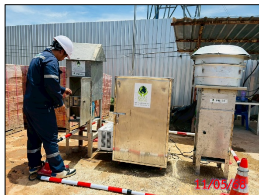
รูปที่ 3.5-5 จุดตรวจวัดคุณภาพอากาศในบรรยากาศโดยทั่วไป ประจำเดือนพฤษภาคม 2568 (ระหว่างวันที่ 11-14 พฤษภาคม 2568)