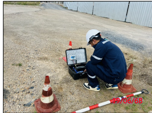
รูปที่ 3.7-6 จุดตรวจวัดระดับความสั่นสะเทือน ประจำเดือนมิถุนายน 2568 (ระหว่างวันที่ 19-22 มิถุนายน 2568)